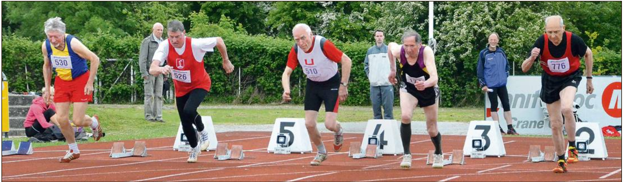
Start des 100-Meter-Laufes der Altersklassen M75 und M 80. Am Wochenende fanden die Leichtathletik-Landesmeisterschaften der Senioren in Wilhelmshaven statt.

Die deutsche Nationalmannschaft der Frauen bucht nach einem Sieg in der Ukraine das WM-Ticket – Seite 17